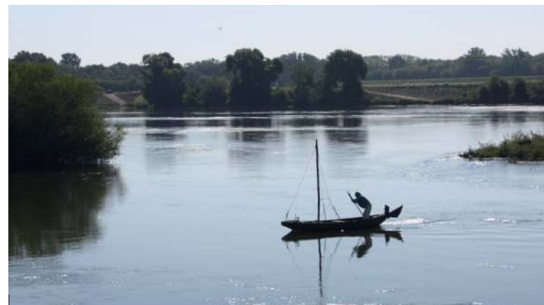
Cour-sur-Loire : la traversée du fleuve